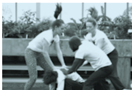
Piotruś i Wilk. Reinterpretacja