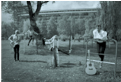
Wszystkie dzieci Laura zje

Koncert dla małych i dużych dzieci oraz małych i dużych dorosłych. Bo wszystkie dzieci nasze są. Dorośli też. Wstęp wolny