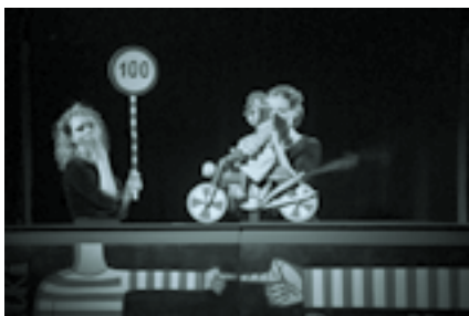
Dziadki, dziatki

Spektakl dla dzieci od lat 4 Cena biletu – 8 zł