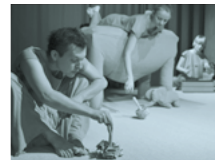
Stoń Trąbibombi

Scenariusz i reżyseria: Beata Bąblińska, Monika Kabacińska